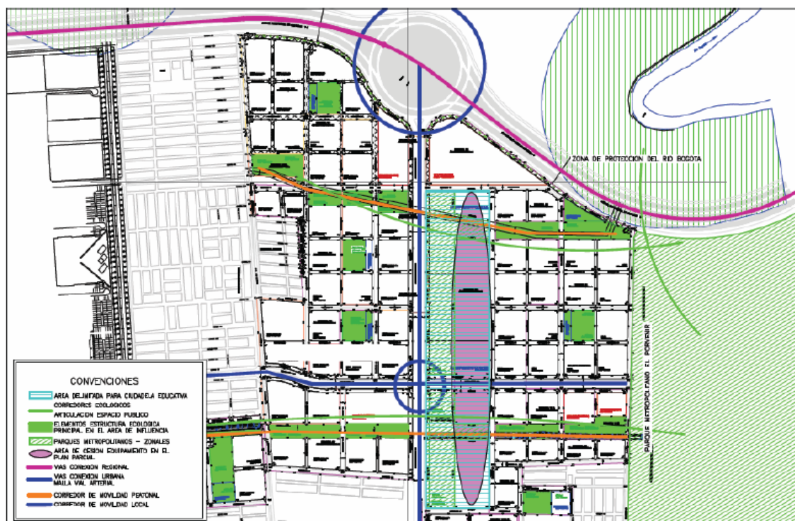
Figura. Lineamientos de Implantación

El lote se encuentra ubicado en la localidad de Bosa al sur occidente de la ciudad, sobre los límites de río Bogotá con en el perímetro urbano, en la ciudadela el Porvenir, es parte de la sesión gratuita al Distrito y se localizan equipamientos comunales. En el caso de la Universidad Distrital con dos predios, participando en la sesión con 3,17 Hectáreas