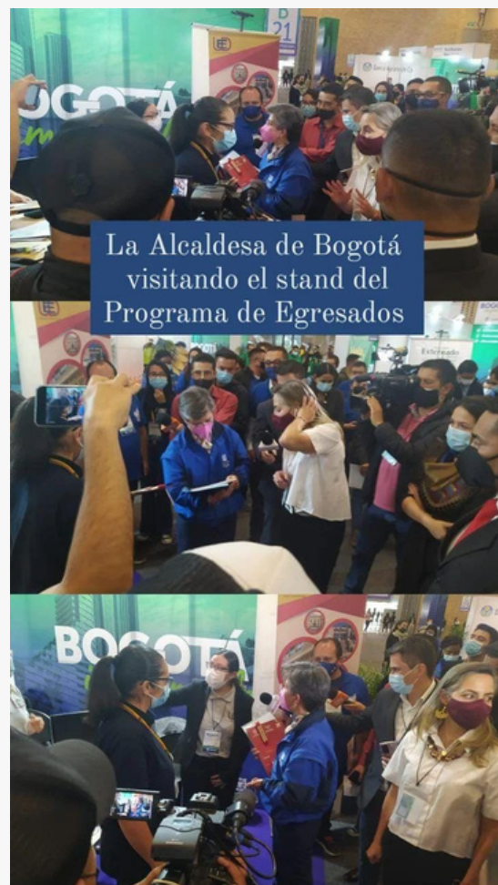
La Alcaldesa de Bogotá visitando el stand del Programa de Egresados