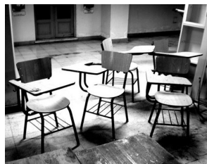
VANGUARDIA. Febrero 2013.

en los primeros semestres se retira y c) Deserción tardía: individuo que en los últimos semestres no continúa sus