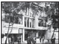
Primera sede ubicada en la calle 10 con carrera 8, frente al Palacio Liévano y el Capitolio Nacional.

En el año de 1950 mediante la resolución 139 del Ministerio de Defensa, la Universidad recibió el nombre de Universidad Municipal “Francisco José de Caldas”. Posteriormente, al erigirse la ciudad de Bogotá como Distrito Especial, recibió el nombre de Universidad Distrital Francisco José de Caldas.